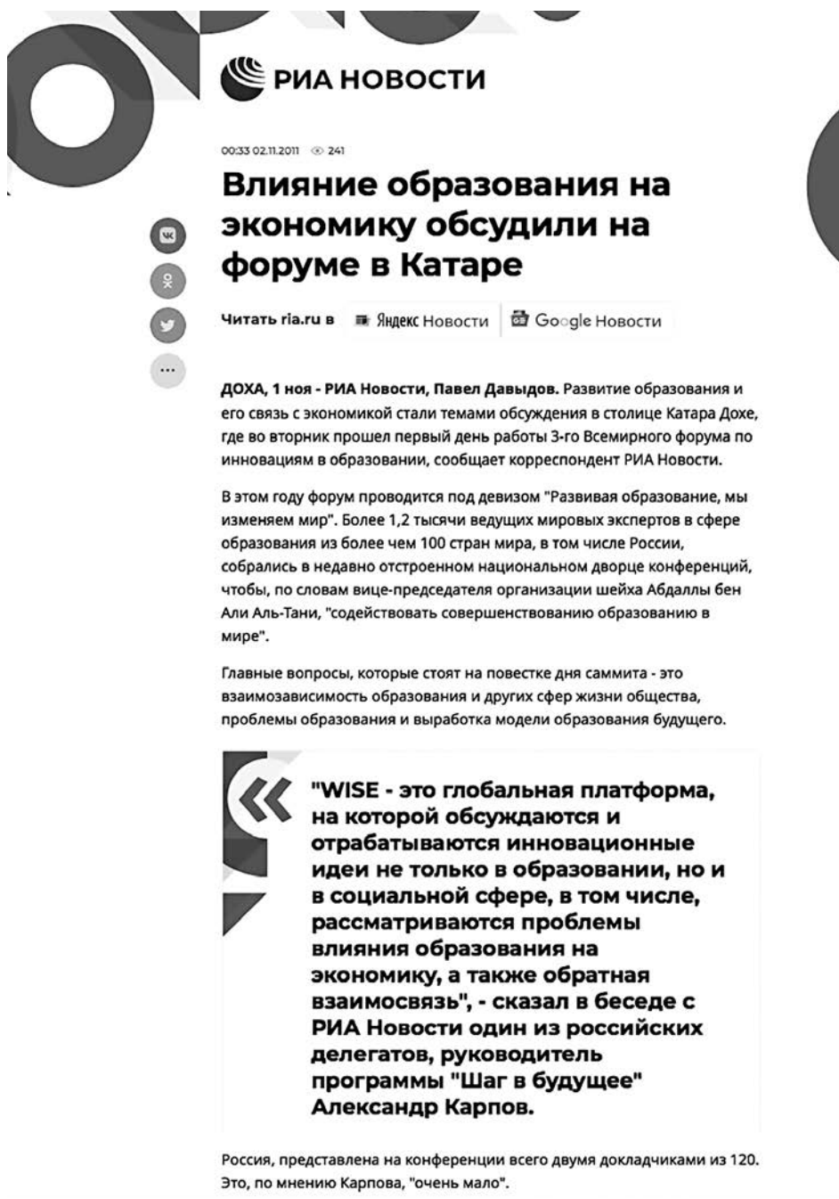
Рисунок 4. Фрагмент страницы на сайте РИА Новости с сообщением о Всемирном инновационном саммите WISE и выдержкой из интервью, взятого у автора